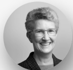
Janine Guillot CEO, Value Reporting Foundation

INSPIRATION, TRENDS UND INTERNATIONALE BEST PRACTICE CASES MIT EXPERTINNEN UND EXPERTEN WIE: